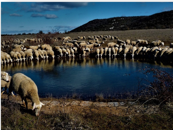
Brebis qui s'abreuvent